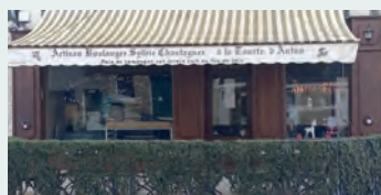
► BOULANGERIE NAUDY - 78 avenue Charles de Gaulle - Succède à La Tourte d'antan. Perpétue la tradition artisanale tout en insufflant un nouveau dynamisme.