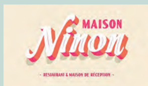
► MAISON NINON - 1992 avenue des jardins - Une expérience culinaire raffinée où authenticité et créativité se rencontrent.