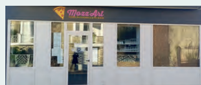
► PIZZERIA MOZZ'ART - 7 avenue Jean Jaurès - Carte généreuse et gourmande.