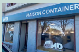
► MD MAISON CONTAINER - 20 avenue Charles de Gaulle - Solutions innovantes et sur mesure de transformation de containers maritimes en habitats, bureaux, extensions ou modules techniques.