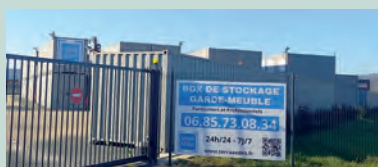
► TERRA.AEDES BOX DORDOGNE - 124 rue Marcel Michelin - Solutions de stockage en containers pour particuliers et professionnels.