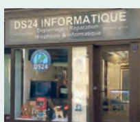
► DS 24 - 23 rue Cournarie - Réparateur de téléphones et ordinateurs. Interventions rapides.