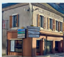
► BOULANGERIE-PÂTISSERIE SAINTE CATHERINE - 14 de rue Cournarie - Pains artisanaux, pâtisseries, viennoiseries et sélection de chocolats.