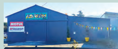
► AUTO PASSION - Zone des Fauries, 584 route Jean Aymard - Garage automobile qui complète l'offre de services mécaniques.